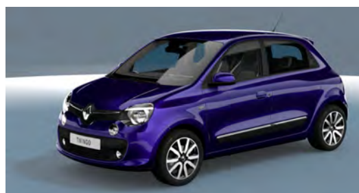
Ultra violeta LNF