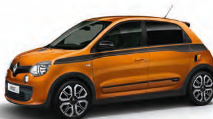
Piparu oranža (tikai GT versijai) EPP