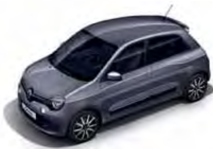
Mēness pelēka KPE