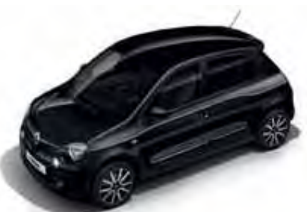
Koši melna GNE