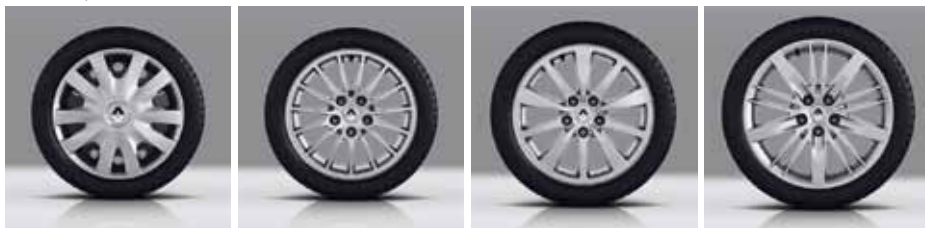
16 COLLU DEKORATĪVĀS UZLIKAS «BAYADERE»